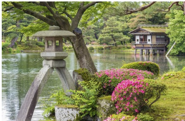
Der Kenrukuen Garten von Kanazawa

Mo 21.04.25 / 12. Erlebnis-Tag: Kanazawa ! Kanazawa, am Pazifik gelegen, ist Japan „en miniature“: hier besuchen wir: