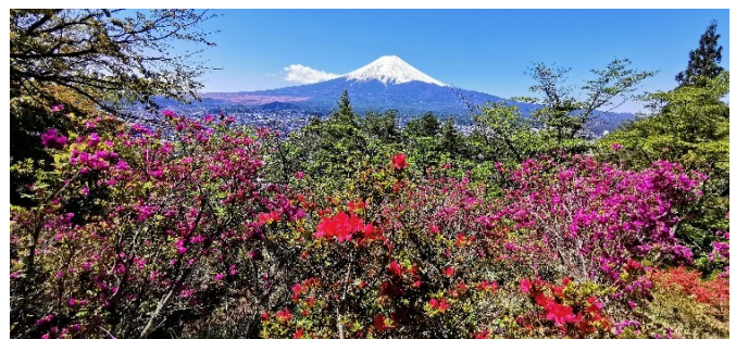
Azaleen-Blüte am Mt. Fuji

Do 17.04.25 / 8. Erlebnis-Tag: Heute kommen alle Teilnehmer(innen), die sich an Blüten und Pflanzen erfreuen, voll auf ihre Kosten. Mit dem Zug fahren wir durch eine schöne Landschaft zum Ashikaga Flower Park . Dieser Park ist berühmt durch einzigartige Wisteria-Bestände. Die dortigen „Blauregen“-Pflanzen (auch noch „Glyzinien“ genannt) sind teilweise über 100 Jahre alt, die bis zu 1,80 m langen Blüten-Kaskaden leuchten in Blau- und Violett-Farben. Aber auch weiße Wisteria-Blüten sind zu bewundern. Der Park hat noch viele andere Pflanzen zu bieten – Sie werden immer wieder neue Fotomotive finden.... Zutiefst beeindruckt von dem heutigen Farben-Spektakel fahren wir zurück nach Tokyo und übernachten im Stadtviertel Ginza.