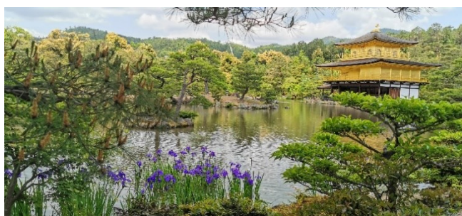
Der Goldene Pavillon in Kyoto

So 20.04.25 / 11. Erlebnis-Tag: Stadtbesichtigung in Kyoto mit Ihrer Atlantis-Reiseleitung. Über 1000 Jahre lang war Kyoto die Hauptstadt des Kaiserreiches. Die Stadt Kyoto bietet 1600 buddhistische Tempel, 400 shintoistische Schreine und allein 17 Stätten mit dem Prädikat „UNESCO-Weltkulturerbe“. Sie erhalten von uns eine Tageskarte für das Bus-Netz von Kyoto mit unbegrenzter Nutzung am heutigen Tag.