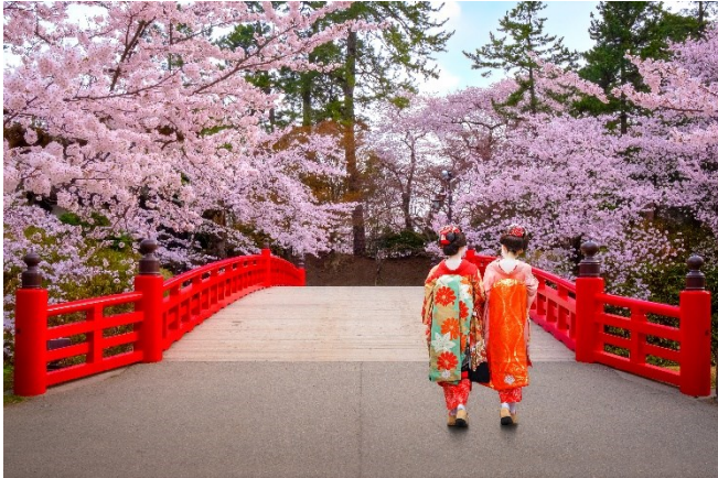
Hirosaki Castle Park