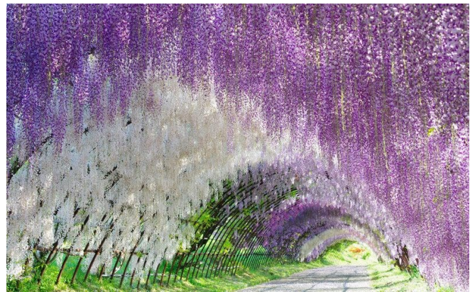
Wisteria - Tunnel im Ashikaga Park