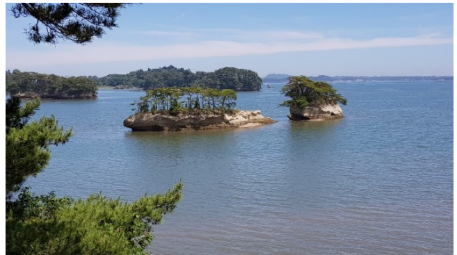
Kiefer-Inseln vor Matsushima

besuchen – Ihre Reiseleitung kennt hierfür die richtigen Adressen.