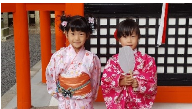
Mädchen in Kimonos am Inari Schrein

Sa 19.04.25 / 10. Erlebnis-Tag: Tokyo-Kyoto ... Heute fahren wir mit dem Shinkansen nach Kyoto , mit etwas Wetter-Glück haben wir unterwegs einen schönen Blick auf den Mt.Fuji. Nach Ankunft in Kyoto checken wir in unserem Hotel in unmittelbarer Bahnhofsnahe ein. Am Nachmittag hat der stadtnahe Fushimi Inari-Schrein die besten Lichtverhältnisse zum Fotografieren. Der Schrein mit seiner kilometerlangen Tori-Galerie wurde durch den Film „Die Geisha“ weltberühmt. Sie können hier hunderte von Besucherinnen in farbenprächtige Kimonos fotografieren.