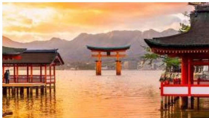
Insel Miyajima / Hiroshima

den attraktiven Ohmicho-Markt mit Meeresfrüchten, die Sie noch nie zuvor gesehen haben... das wunderschöne Samurai-Wohnviertel Naga Machi Buki , wo die Zeit stehen geblieben ist... den traumhaften Kenrokuen Garten (einen der drei schönsten Gärten Japans) neben einer Burganlage ...das ehemalige Geisha-Viertel Kuzemachi Chaya und das Altstadtviertel Higashi Chaya mit 200 Jahre alten traditionellen Holzhäusern... das alles werden wir Ihnen heute präsentieren ... ein wunderbarer Ganztagesausflug !