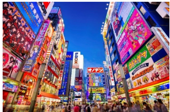
Akihabara im Lichterglanz